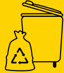
GELBE TONNE & GELBER SACK